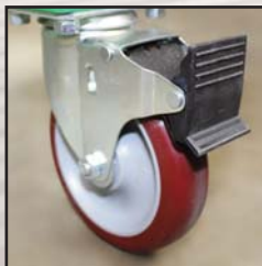
Ruedas giratorias de 5"